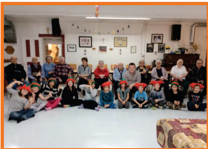
Rencontre sociale entre les élèves de l'école primaire et le Club de l'âge d'or