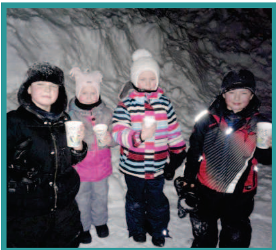
Soirée patins et chocolat chaud – Hiver 2018