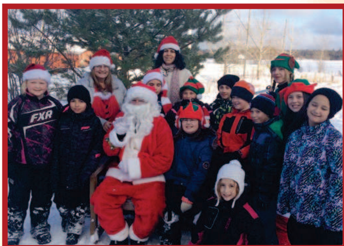
Activité du Père Noël – Décembre 2017